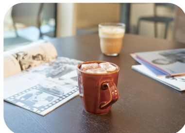
●ホットチョコレート 715円 ●キャラメルマキアート 495円