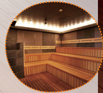
男性フィンランド サウナ

2月28日(月)まで フィンランドフェアを実施中! サウナや料理、イベントバスなど 多彩なフィンランド体験が 楽しめます。