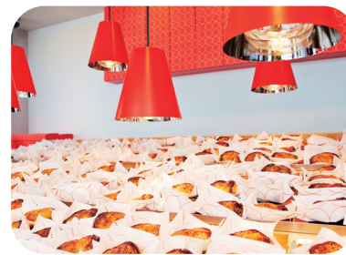
●カスタードアップルパイ 1個 420円 ※混雑時は1人4個まで